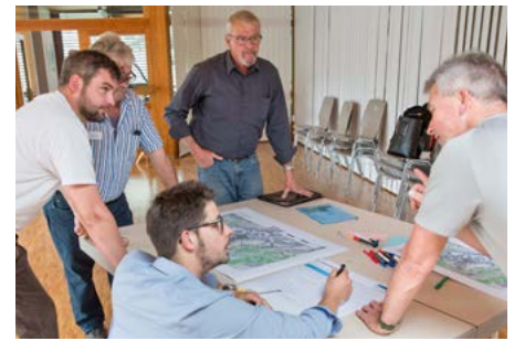
Abbildung 2: Erarbeitung des Landschaftsqualitätsprojektes UNESCO: Im Rahmen der Projekterarbeitung wurde ein Workshop mit Akteuren aus fünf Landschaftsräumen des Projektgebiets durchgeführt. Dabei wurden konkrete Massnahmen für die Förderung von Landschaftsqualitäten diskutiert und definiert.

Dazu muss der Kanton in Zusammenarbeit mit den regionalen Trägerschaften ein Landschaftsqualitätsprojekt ausarbeiten. Die Grundlage für die Formulierung von Landschaftsqualitätszielen und Massnahmen bildet eine Landschaftsanalyse (Auszüge daraus am Beispiel des Wallis: siehe Box 2-4). Bei dieser Analyse werden regional spezifische Besonderheiten und charakteristische Landschaftselemente herausgearbeitet. Für die Erhaltung dieser Besonderheiten können Landwirtinnen und Landwirte, nach Abschluss mehrjähriger Vereinbarungen mit dem Kanton, entschädigt werden (siehe Tabelle 1). In der Welterbe-Region wurden bis 2017 drei Landschaftsqualitätsprojekte in den Projektperimetern „Lötschental“ (VS), „Kandertal“ und „Oberland-Ost“ (BE) ausgearbeitet. Ein weiteres Projekt im Perimeter „UNESCO“, welches die Walliser Gemeinden der Welterbe-Region (ohne Lötschental) betrifft, wurde 2016 vom Kanton Wallis und der Gemeinde Naters initiiert und vom Managementzentrum